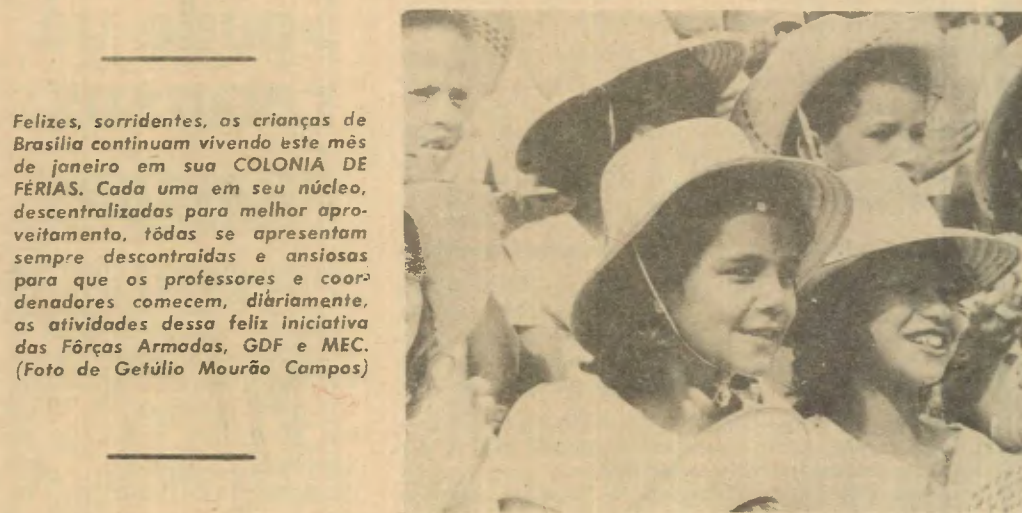
Felizes, sorridentes, as crianças de Brasília continuam vivendo este mês de janeiro em sua COLÔNIA DE FÉRIAS. Cada uma em seu núcleo, descentralizadas para melhor aproveitamento, todas se apresentam sempre descontraídas e ansiosas para que os professores e coordenadores comecem, diariamente, as atividades dessa feliz iniciativa das Forças Armadas, GDF e MEC.