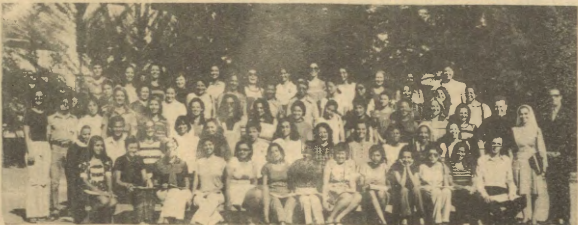
"EUREKA" FEMININO - Realizou-se no Seminário Arquidiocesano de Brasília o II Encontro "Eureka" Feminino nos presentes quarenta e seis jovens. Foram dias de estudos e meditação, em uma convivência proveitosa, com palestras religiosas e um amplo programa de confraternização

- PARTICIPE VOCE TAMBÉM DO GOVERNO ZELANDO PELOS BENS PÚBLICOS.