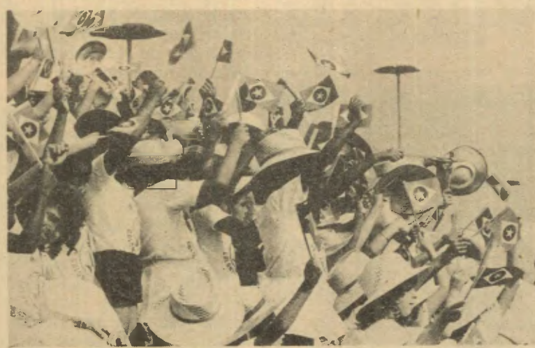
Em todos os instantes da Colônia de Férias a vibração das crianças é a mesma. Durante os jogos e brincadeiras, na fila do lanche sempre alegria. Mas, o principal para todos é quando canta o Hino Nacional Brasileiro, aquele significativo final das crianças lançando aos ares "Viva o Brasil". É assim que vão passando nos vários núcleos do Distrito Federal, onde se aprende, realmente, a ser "O AMANHÃ"!