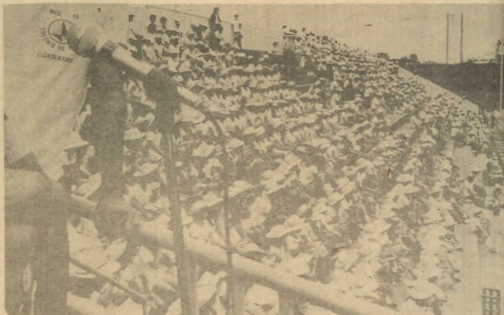
Mais de mil colonins, dos três núcleos da Colônia de Férias de Taguatinga, concentraram-se na Esportes do Centro Social Presidente Eurico Gaspar Dutra, do SESI, para uma ação cívica conjunta.

O General Figueiredo agradeceu a homenagem, dizendo que ela aumentava ainda mais os laços de amizade que o prendem aos assessores presidenciais.