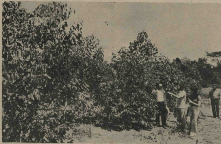
O Secretário de Agricultura e Produção durante visita à Estação Experimental "Cabeça de Veado", onde estão sendo desenvolvidos projetos de reflorestamento

O lançamento das competições foi iniciado em 14 de janeiro de 1970 com os pinus Taeda, em 28 parcelas, com espaçamento de 5 por 5 metros, empregando-se 1.400 mudas. Em 1971, no mês de novembro, foi iniciado o experimento com a variedade hondurensis de pinus Caribea, utilizando-se 1.350 mudas. Na mesma ocasião, também foi introduzido no campo de experimentação 1.350 mudas de pinus Oocarpa.