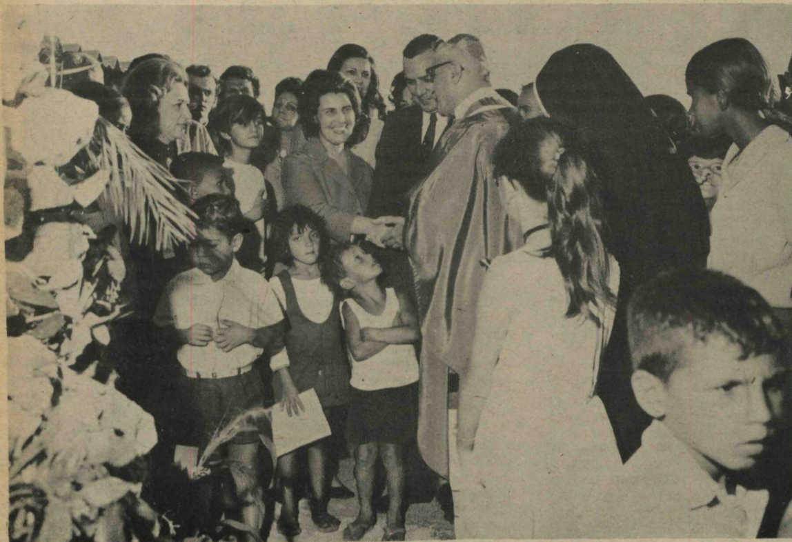
O Arcebispo de Brasília, Dom José Newton de Almeida Batista, cumprimenta a Primeira-Dama da Cidade e Presidente da Campanha de Erradicação de Invasões, Sra. Vera de Almeida Silveira, durante as solenidades de inauguração da primeira creche da Ceilândia construída pela Casa do Candango

A Casa do Candango inaugurou uma creche na Ceilândia, em solenidade que contou com a presença do Governador Prates da Silveira e da Primeira-Dama da Cidade, Da. Vera de Almeida Silveira.