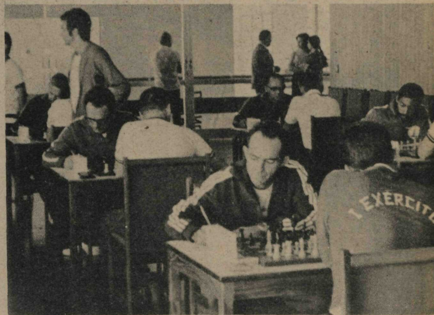
Aspecto parcial da Sala de Jogos do Clube do Congresso, onde foram realizadas todas as rodadas.

PREMIAÇÃO - Aos primeiros colocados foram ofertadas Medalha de Vermeil, tanto de equipe como individual. Aos segundos, Medalha de Prata, equipe e individual. Aos terceiros, Medalha de Bronze, equipe e individual. Segundo o "Boletim Oficial das Olimpíadas" - "A introdução do Campeonato de Xadrez nas Olimpíadas do Exército veio não só preencher uma sensível lacuna em nossa magna competição, como, também, é uma resposta aos anseios de uma gama de enxadristas, que esperavam poder participar desse encontro com os amigos distantes". "Sua prática, a movimentação das peças, transcendem de uma simples atividade de tabuleiro, para encontrarem conotações nas virtudes inerentes a todos os militares, em especial aos chefes". "Decisão, iniciativa, pronta resposta, estudos de linhas de ação, entre outros, são os fatores que proporcionam entrelaçamento mencionado".