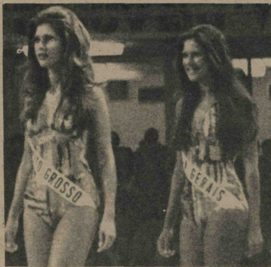
Duas belas candidatas: "Miss Mato Grosso" e "Miss Minas Gerais" foram escolhidas para semifinalistas.