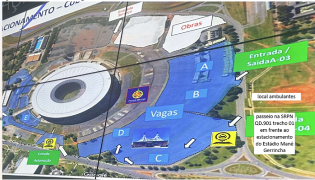
ÁREA 01 – SRPN QD.901 trecho 01 – Asa Norte, 20 vagas de barraca e 25 caixeiros.

13.1. Não haverá reserva de vagas no chamamento público para as associações representativas da categoria dos Ambulantes.