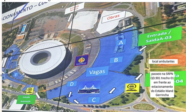
ÁREA 01 – SRPN QD.901 trecho 01 – Asa Norte, 20 vagas de barraca e 25 caixeiros.

13.1. Não haverá reserva de vagas no chamamento público para as associações representativas da categoria dos Ambulantes.