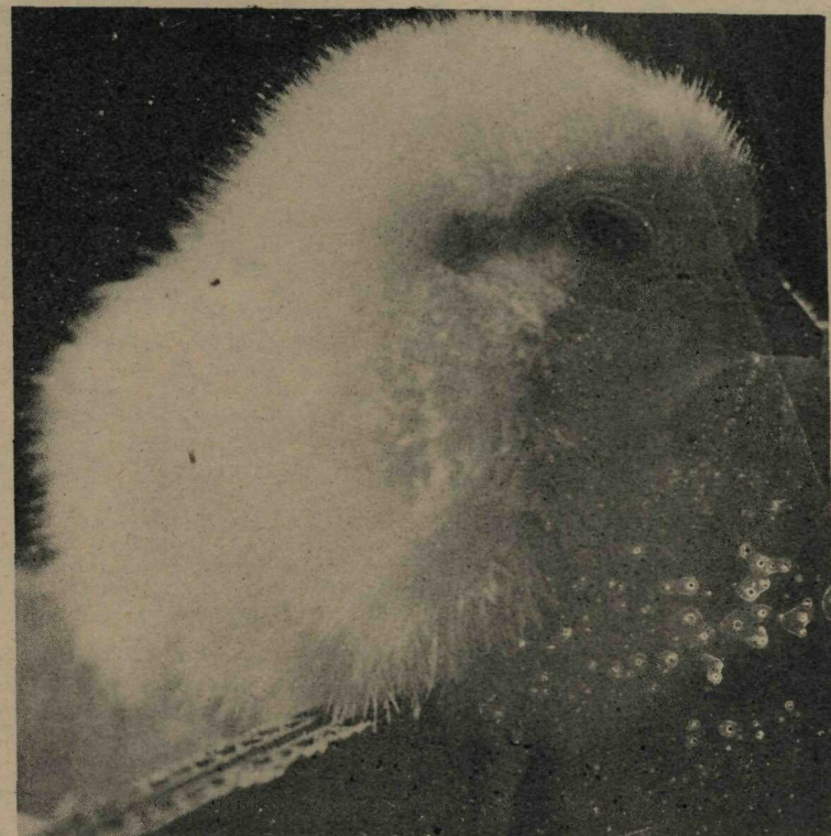
"Fac Simile" da capa da revista "Cerrado", cujo número 24 está circulando