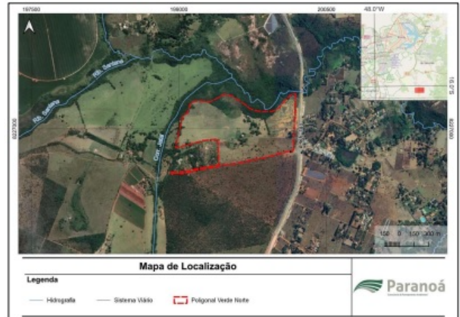
Figura 1: Mapa de Localização do Parcelamento Verde Veredas.

denominado Parcelamento de Solo Urbano - VERDE VEREDAS, localizado à margem da DF-140, localizado na Região Administrativa do Jardim Botânico no Distrito Federal. INTERESSADO: VERDE URBANISMO PARTICIPAÇÕES LTDA. Processo de Licenciamento Ambiental nº SEI 00391-00002892/2023-95. Visando uma maior participação, a Audiência Pública será realizada de forma VIRTUAL E PRESENCIAL, com transmissão ao vivo, no dia 13 DE AGOSTO DE 2024, com início às 19h00min e encerramento previsto para às 22h00min. As instruções relativas aos canais de transmissão e respectivos procedimentos para acesso e participação serão divulgadas previamente, no prazo mínimo de 5 (cinco) dias de antecedência da data de realização da audiência pública, no endereço eletrônico www.ibram.df.gov.br e ficarão disponíveis até o encerramento da Audiência Pública. Os estudos, regulamento da audiência e demais documentação poderão ser acessados por meio do endereço eletrônico www.ibram.df.gov.br .