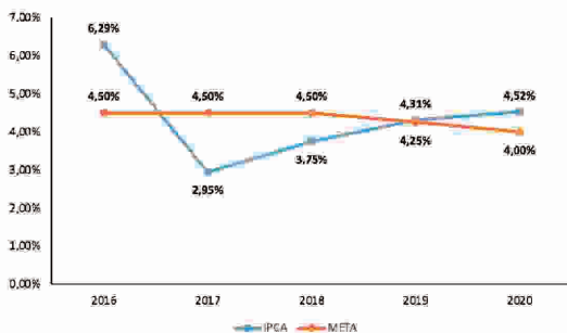
EVOLUÇÃO ANUAL DA INFLAÇÃO (%)