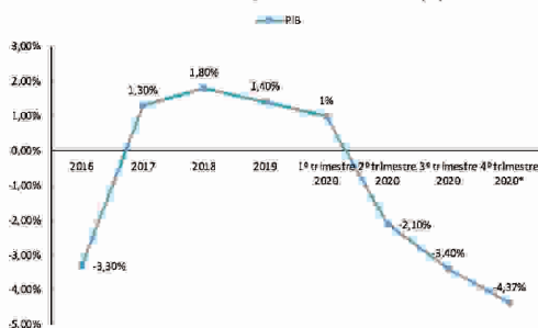
BRASIL – EVOLUÇÃO DO PIB ANUAL – (%)

Fonte: Instituto Brasileiro de Geografia e Estatística – IBGE/Focus- Bacen Retirado da última projeção para 2020 do boletim Focus de 08 de janeiro de 2021