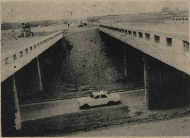
As pontes da nova pista que ligará o Guará ao Plano Piloto já estão prontas. No momento, procede-se ao trabalho de imprimação asfáltica

As obras da nova ligação do Plano Piloto com o Guará II, no trecho compreendido entre o Jardim Zoológico e a Avenida do Contorno daquele núcleo habitacional, prosseguem em ritmo acelerado. Os serviços estão sendo desenvolvidas numa extensão aproximada de dois mil e quinhentos metros.