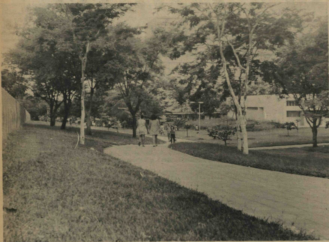
Os verdes de Brasília são uma constante e uma tradição da Cidade. Graças ao Departamento de Parques e Jardins da NOVACAP, Brasília alcança um índice ideal de arborização

O Plano Urbanístico de Brasília, elaborado pelo Arquiteto Lúcio Costa, prevê, dezoito milhões de metros quadrados de área verde cultivada, em seus diversos setores, residenciais, administrativo e comercial. Dêsse total, o Departamento de Parques e Jardins da NOVACAP já realizou trinta por cento, ou seja seis milhões e quinhentos mil metros quadrados, em dez anos de trabalho.