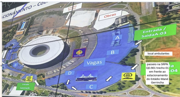
Área 01 Local de Licenciamento - SRPN Qd.901 trecho 01 - Asa Norte/DF. (20 vagas).

EDITAL DE CHAMAMENTO PÚBLICO PARA LOCAÇÃO DE IMÓVEL Nº 001/2025 Edital de Chamamento Público nº 001/2025, com o objetivo de prospectar no mercado imóveis disponíveis para locação que atendam às necessidades da Administração, subsidiando futura contratação de imóvel para abrigar a sede da Administração Regional de Taguatinga. O GOVERNO DO DISTRITO FEDERAL, por meio da Administração Regional de Taguatinga, torna público que pretende selecionar pessoas físicas ou jurídicas, com a finalidade de celebrar contrato de locação de imóvel comercial urbano, na Região Administrativa de Taguatinga - DF, localizado preferencialmente no Centro de Taguatinga - DF -, para acomodar a estrutura organizacional desta Administração, visando ao pleno desenvolvimento de suas atividades, conforme os critérios e procedimentos definidos neste edital, objetivando obter a melhor proposta. Data limite para apresentação da proposta: Até 10 (dez) dias úteis a contar da publicação do edital no Diário Oficial do Distrito Federal (DODF).