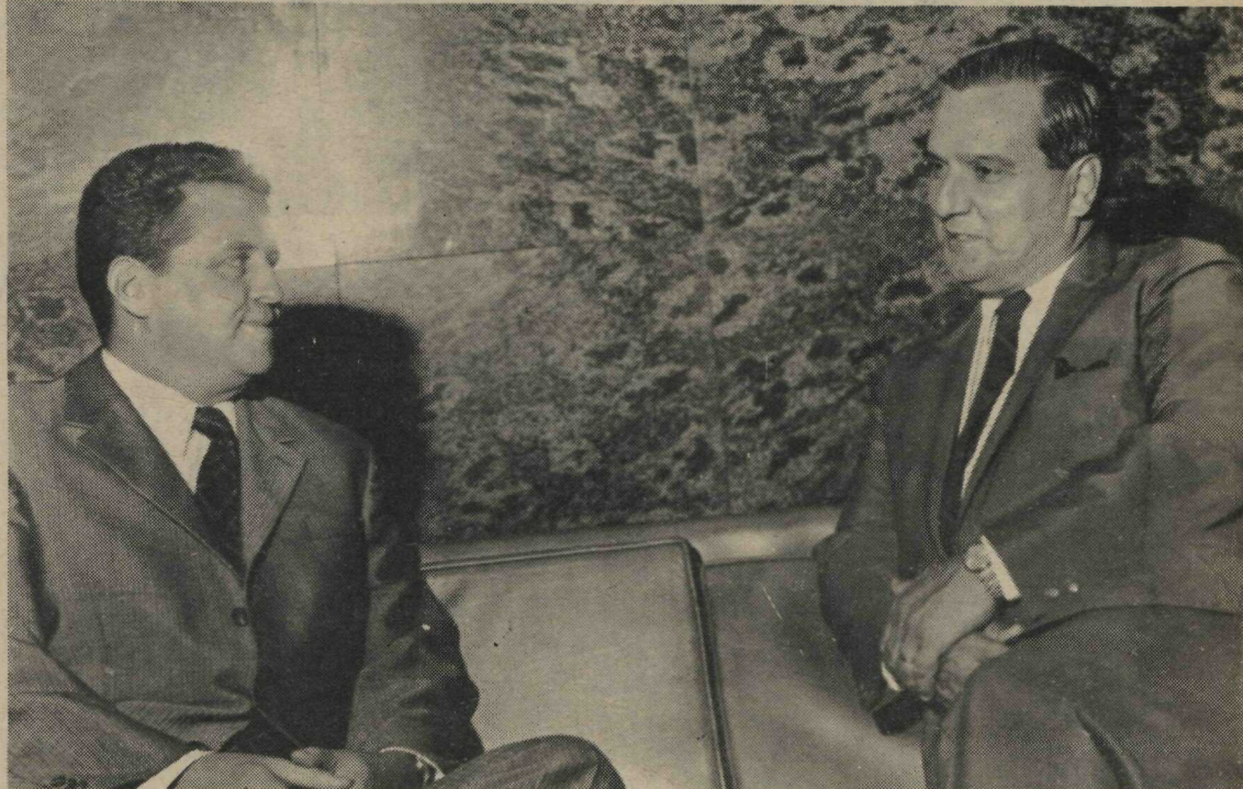
O Encarregado de Negócios da Suíça no Brasil palestra com o Governador do Distrito Federal, a quem revelou sua admiração por Brasília