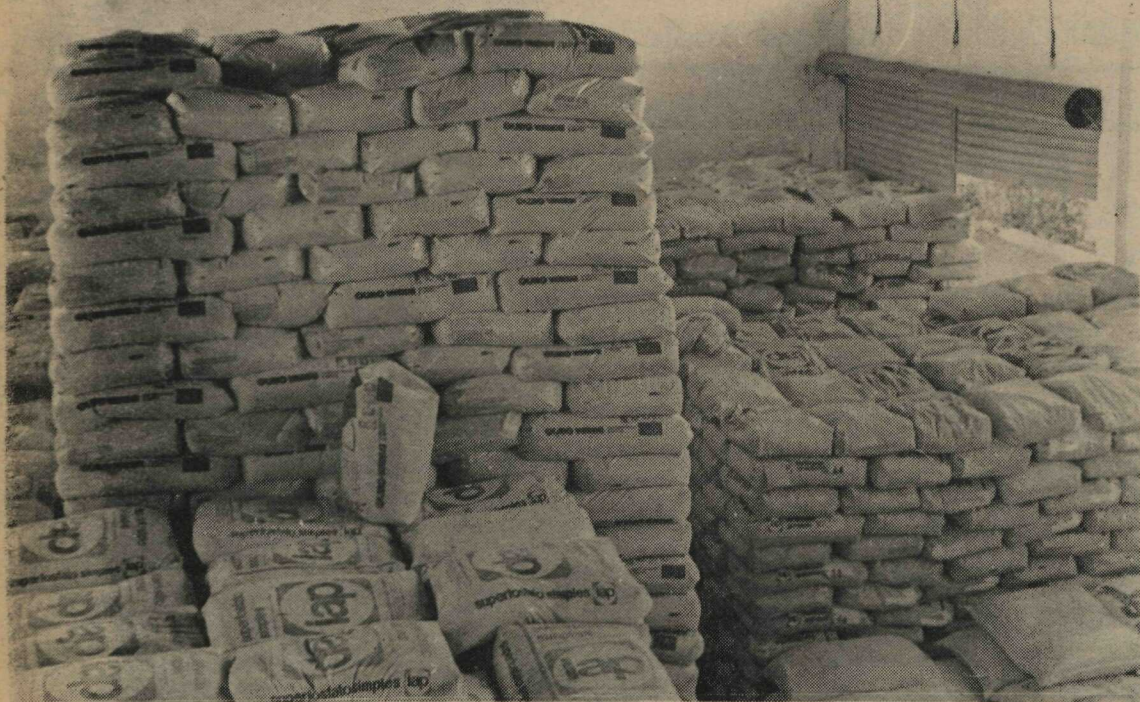
A Secretaria de Agricultura e Produção tem estoque suficiente para abastecer de adubos químicos e orgânicos os agricultores do Distrito Federal e de sua área geoeconômica

Dez mil toneladas de adubos químicos, notadamente fertilizantes nitrogenados, para atender às necessidades dos agricultores do Distrito Federal e sua área de ação, estão sendo armazenados nos depósitos da Secretaria de Agricultura, localizados no Setor de Indústria e Abastecimento.