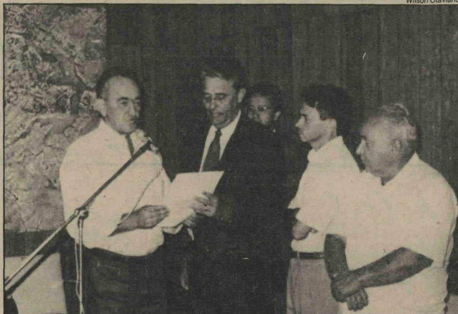
Os produtores com Roriz e a certeza de que a transferência do parque é medida das mais corretas

dos tendo em vista existência de ação popular na Justiça de Brasília que questiona a permissão de uso feita pelo governador à ACP. Eles estão revoltados com reportagem publicada pelo jornal Folha de S. Paulo no último dia 6, que faz pré-julgamento da ação, "desconhecendo o papel da Associação dos Criadores do Planalto no incentivo às atividades agropecuárias".