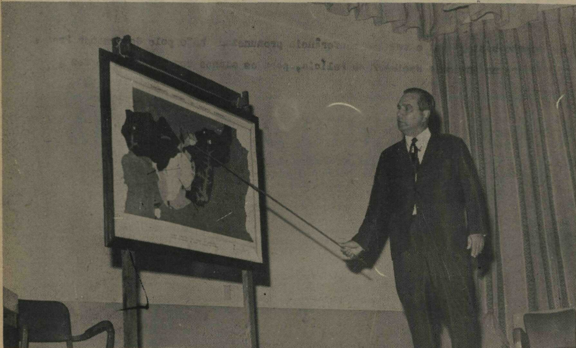
Falando para alunos da Academia Nacional de Polícia, o Governador Hélio Prates da Silveira mostrou um mapa do Zoneamento Sanitário do Distrito Federal, de suma importância para o futuro da Capital do País

Por outro lado, o DVO está colocando meios-fios em toda a extensão da pista que liga a Avenida Comercial Norte com a Ceilândia. A Administração Regional vem mantendo contato com o Departamento de Parques e Jardins para a arborização dessa Avenida e da Avenida Comercial.