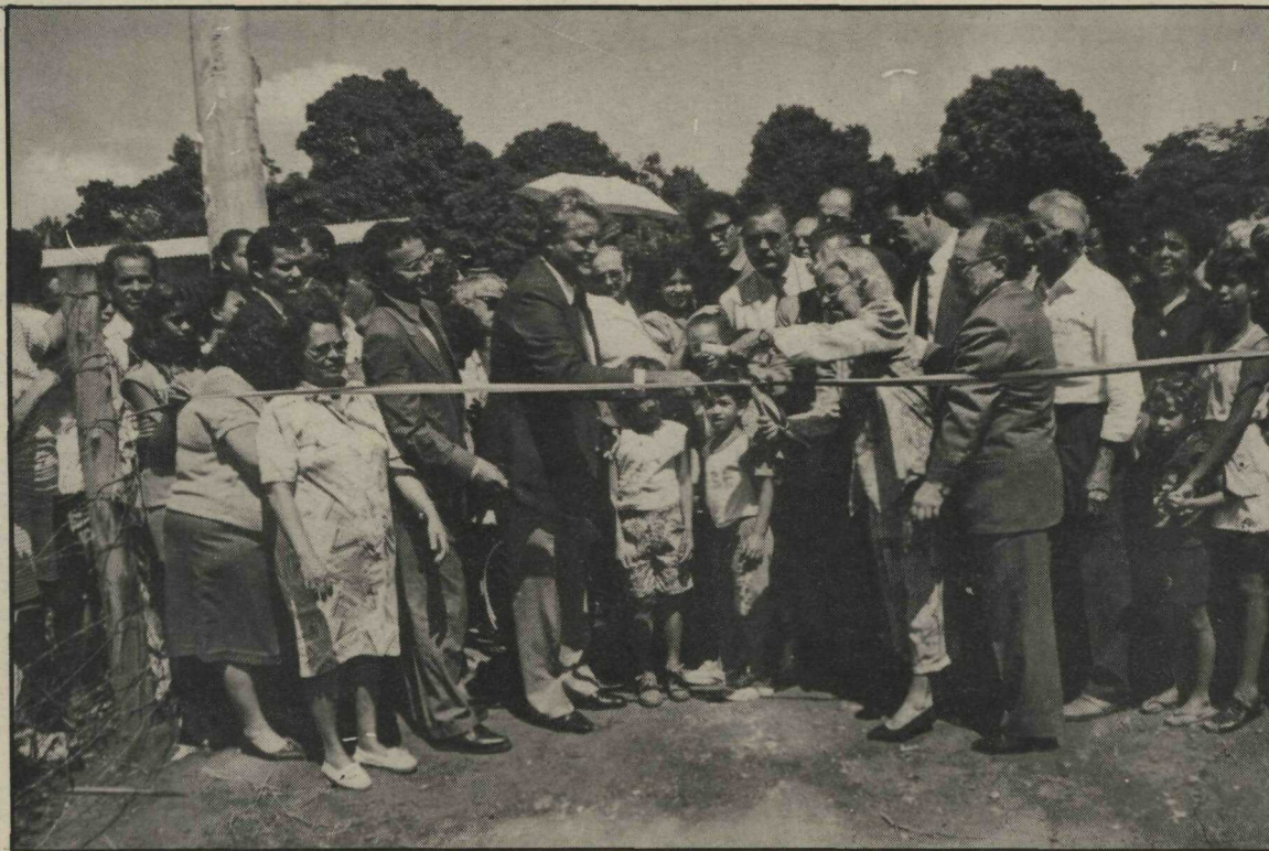
Os moradores acompanham o governador na inauguração de várias obras