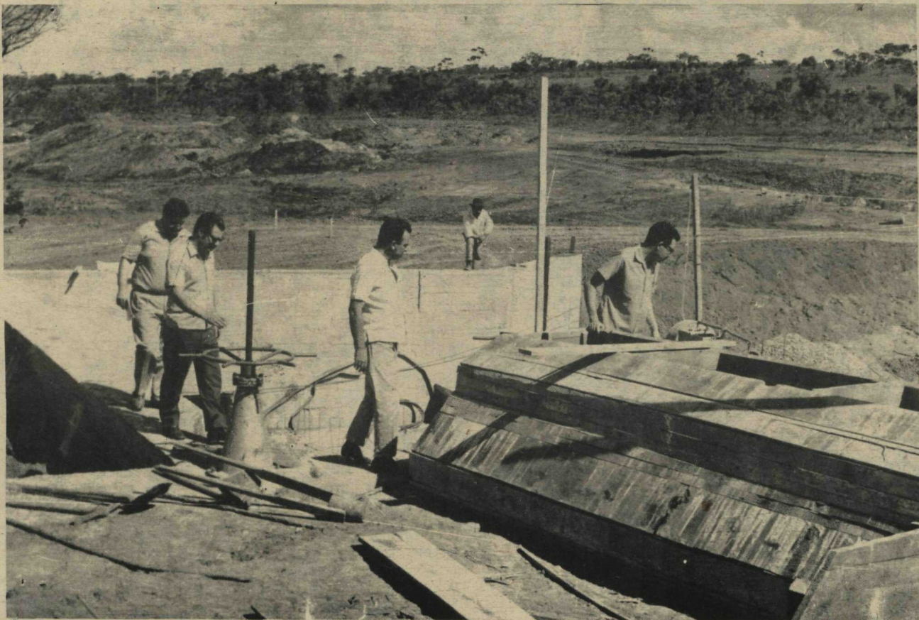
O Prefeito Wadjó Gomide, o Secretário de Viação e Obras e o Diretor-interino do DAE na ocasião em que visitavam as obras da Barragem do "Corguinho", com capacidade de atendimento de 60 mil habitantes e que servirá à cidade-satélite de Planaltina. As obras estão orçadas em 220 mil cruzeiros novos e deverão estar concluídas em fins de fevereiro. A foto mostra o momento em que o Governador da Cidade inspecionava as obras, em companhia de auxiliares.

Espera-se que cada corpo-de-bombeiros possa transformar-se em um cordial centro de orientação em favor dos cidadãos das vizinhanças, além de servir de garagem para o equipamento de combate ao fogo.