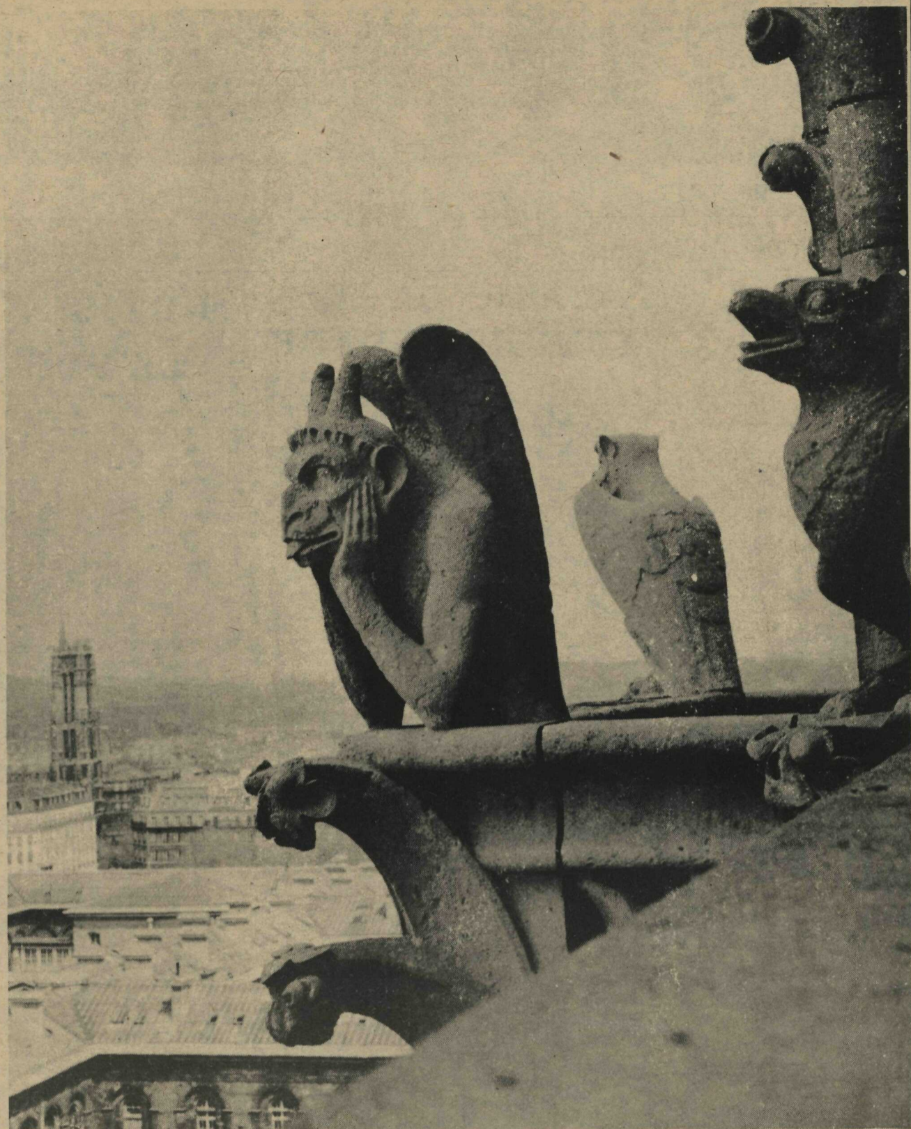
Gárgulas de Notre Dame de Paris

A igreja de NOTRE-DAME de Paris é obra do Bispo de Maurice de Sully, que lançou seus alicerces em 1163, e, no fim da vida, em 1196, viu concretizado o essencial do seu empreendimento. Para erguê-la, Maurice de