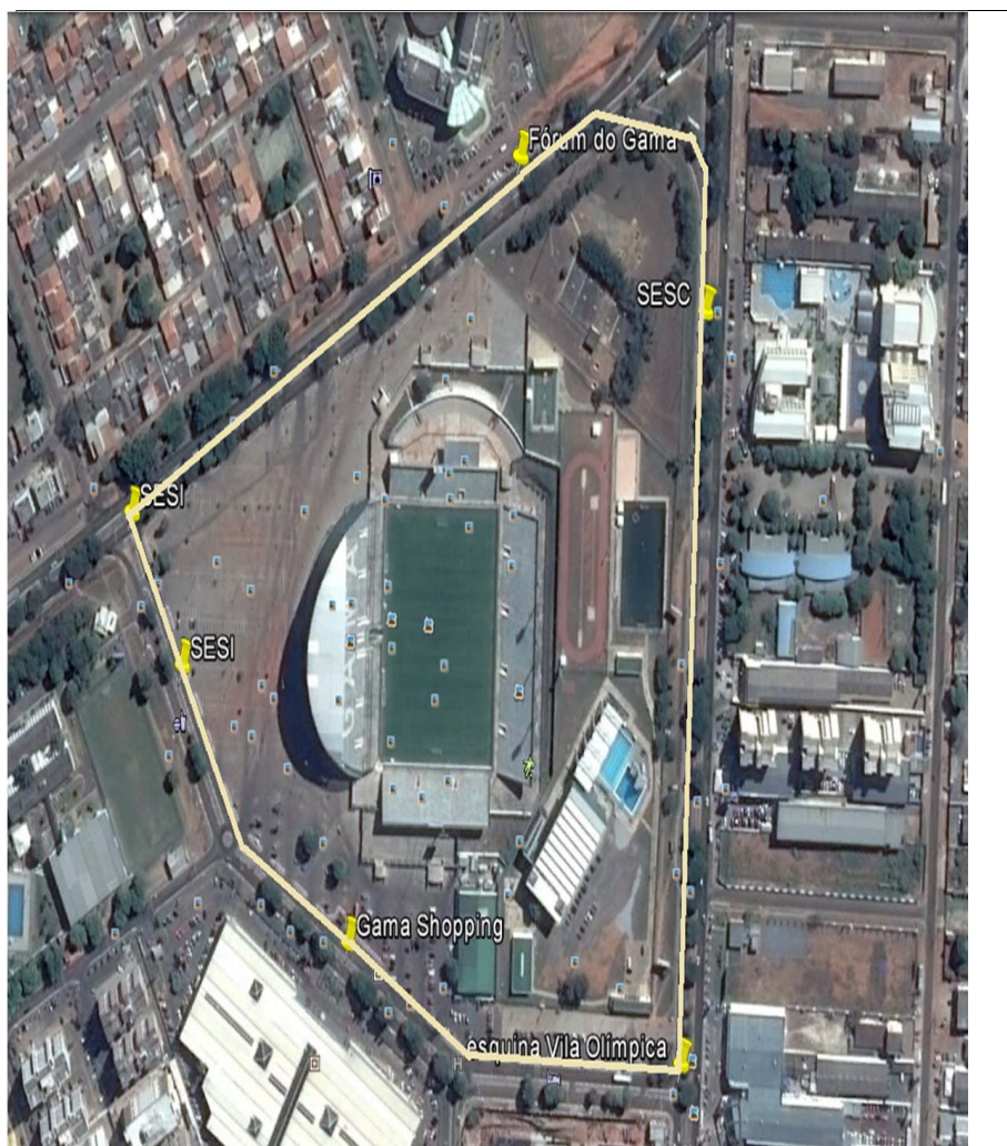
IV - Perímetro de Intensificação de Segurança do COT 2: compreende toda a área comercial e residencial que circunvizinham o Estádio Bezerrão, abrangendo a via do Setor de Indústria aos fundos da Garagem da VIPLAN, descendo no sentido norte/sul, passando nos fundos do SESC rumo à via central lateral à Praça do Cine Itapuã, convergindo à direita no sentido da rotatória do Supermercado Supermaia, dirigindo-se à esquerda pelo Colégio JK ao Setor Oeste, passando pela via da Administração Regional rumo à Feira Permanente até à rotatória do Shopping Popular, subindo à direita no sentido dos Conjuntos G e H da EQ. 1/2, acessando a via central do quartel do CBMDF, subindo à esquerda e retomando, no primeiro acesso à direita, ao ponto inicial da garagem da VIPLAN.

Parecer nº 85/2014/ATJ/DLF. Referência: Processo 054.001.243/2012. Assunto: Análise da Minuta de Edital de Pregão Eletrônico nº 26/2014, referente ao Processo 054.001.243/2012,