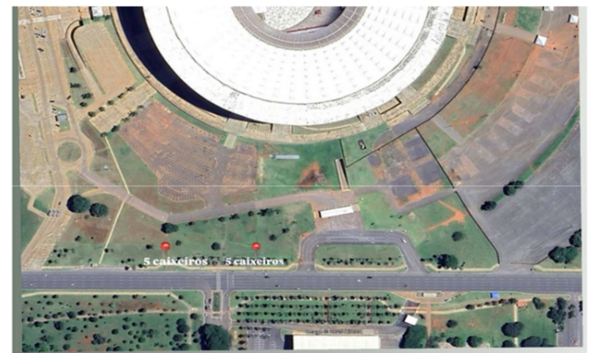
Área 03, 20 vagas de caixeiro no calçadão do Estádio Mané Garrincha, SRPN - Asa Norte/DF.