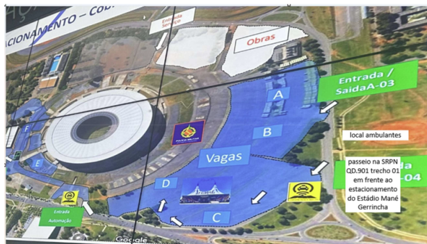
ÁREA 01 – 25 vagas na SRPN QD.901 trecho 01

EXTRATO DO TERCEIRO TERMO ADITIVO AO CONTRATO Nº 48.509/2023 Processo nº 04033-00000300/2023-85. A SECRETARIA DE ESTADO DE ECONOMIA DO DISTRITO FEDERAL, na qualidade de CONTRATANTE, e a ALVORADA SERVIÇOS DE REFORMA EM GERAL LTDA - ME inscrita no CNPJ/MF sob o nº 11.545.051/0001-15, na qualidade de CONTRATADA. DO OBJETO: prorrogar o prazo de vigência do CONTRATO por 12 (doze) meses, a partir de 02/05/2025 à 01/05/2026; alterar a denominação da representação do Distrito Federal de SECRETARIA DE ESTADO DE PLANEJAMENTO, ORÇAMENTO E ADMINISTRAÇÃO - SEPLAD/DF para SECRETARIA DE ESTADO DE ECONOMIA DO DISTRITO FEDERAL - SEEC/DF; e repactuar os valores unitários de todos os postos em razão da Convenção Coletiva de Trabalho nº DF000042/2025 (copeira e recepcionista) e de Termo Aditivo à Convenção Coletiva de Trabalho nº DF000176/2025, totalizando um acréscimo de R$ 193.672,42, passando o valor do contrato de R$ 2.579.712,38 para R$ 2.773.384,80. DO VALOR: R$ 2.773.384,80. DA DOTAÇÃO ORÇAMENTÁRIA: I - Unidade Orçamentária: 19101; II - Programa de Trabalho: 04.122.8203.8517.0051; III - Natureza