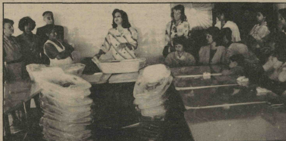
Roriz prometeu às representantes do conselho que Terracap estudará uma área

a assumirem os direitos de cidadania, o Conselho pretende fazer com que aquelas que anunciaram que não votarão em nenhum candidato, possam rever essa atitude. "É preciso e é vital para a vida