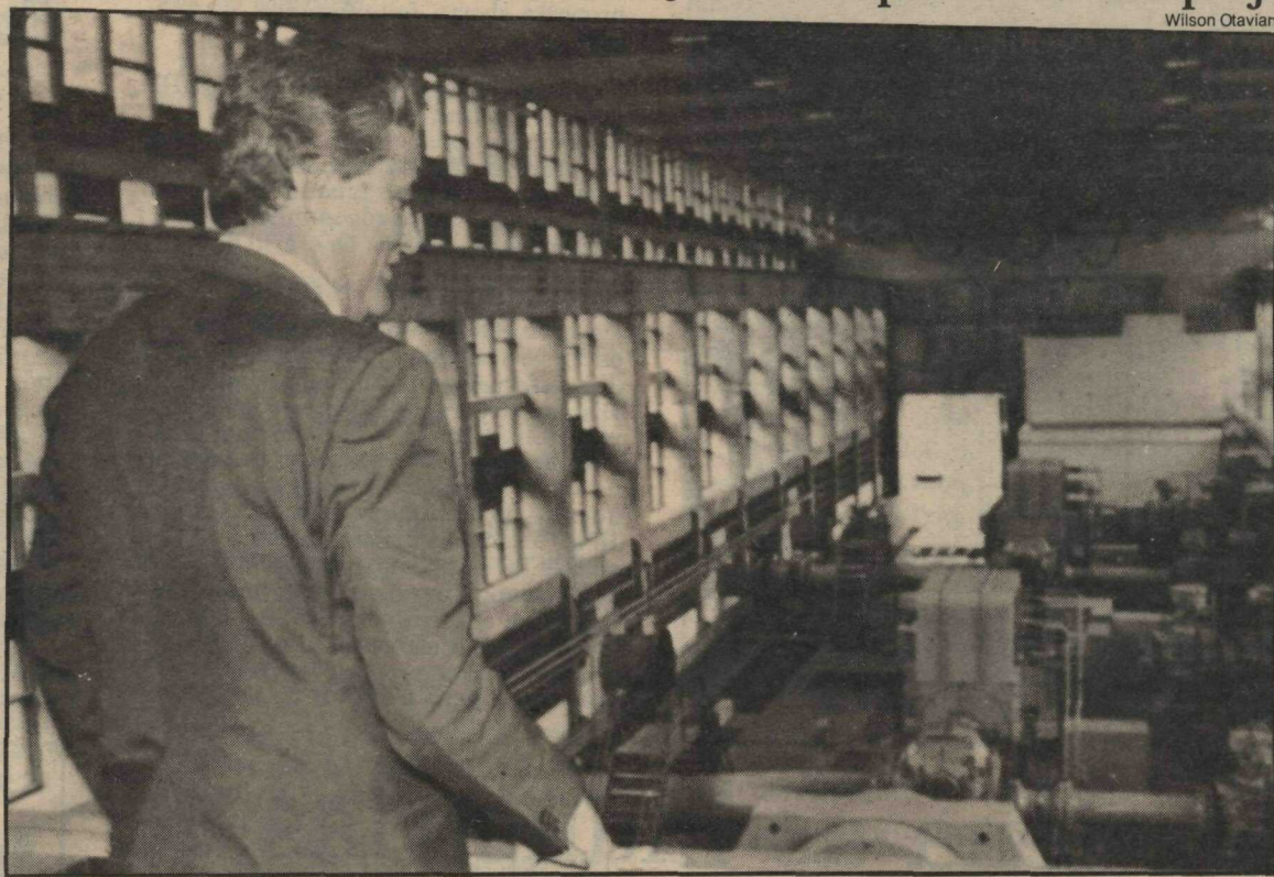
Governador visita a Estação Elevatória do Rio Descoberto, onde a Caesb realiza a ampliação do sistema

Os recursos serão empregados, ainda, na construção de mais duas linhas na elevatória do Descoberto, acrescentando mais 2.500 litros à capacidade da uni-