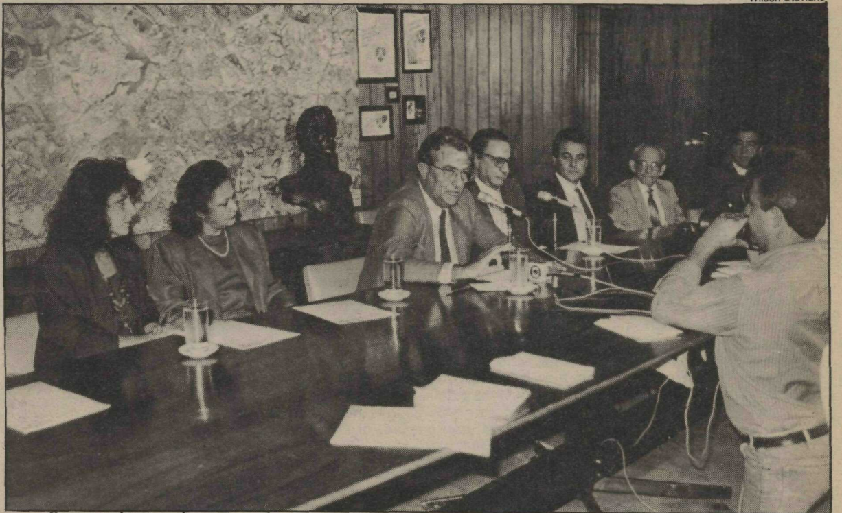
O governador anunciou uma ampla programação de final de ano, envolvendo todos os setores da comunidade

De acordo com o secretário de Indústria, Comércio e Turismo, a campanha de Natal é uma promoção conjunta do Governo do Distrito Federal, Clube dos Diretores Lojistas, Associação Comercial, Sindicato de Hotéis, Bares e Similares e Associação de Supermercados. Além disso — disse ainda Gertrudes — teremos o apoio da Telebrasil, que imprimirá em todas contas telefônicas deste mês uma mensagem incentivando o brasiliense a viver o Natal de Brasília. Somente a Associação de Supermercado mandou imprimir cinco milhões de sacolas com mensagens sobre o Natal.