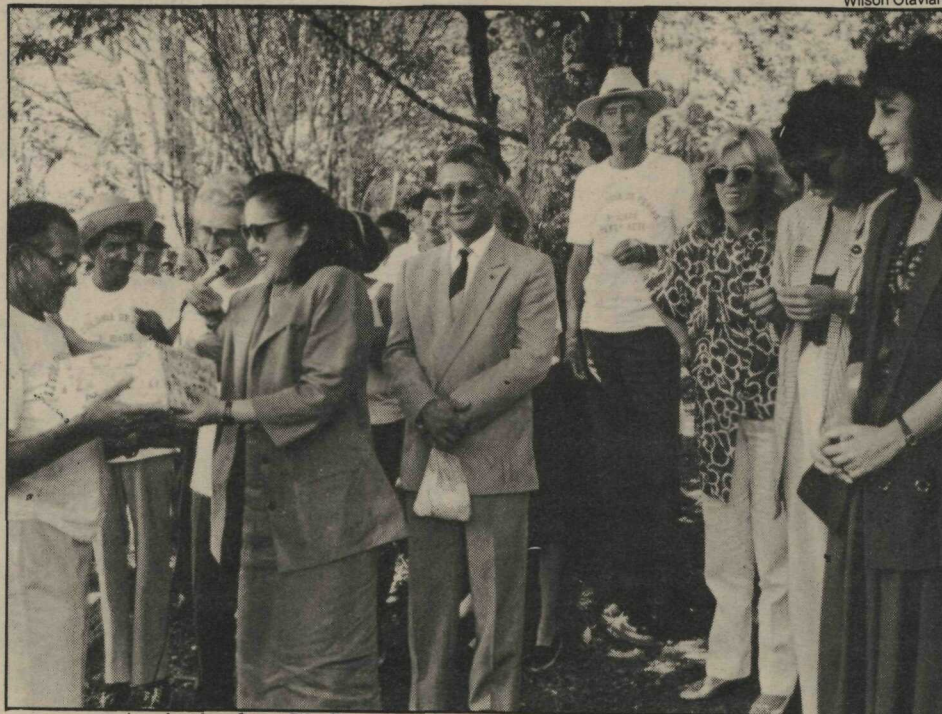
A primeira-dama Weslian Roriz participou, no último dia, do encontro

Cerca de mil idosos participaram da II Colônia de Férias da Terceira Idade, num programa elaborado pelo Departamento de Educação Física, Esporte e Recreação, incluindo visitas ao Congresso Nacional, Palácio do Planalto e outros pontos de atração. A primeira colônia de idosos, no ano passado, teve a duração de uma semana e contou com a participação de trezentos idosos. Este ano, com a escassez de recursos, o acontecimento só durou três dias. A Aeti coordena dezesseis núcleos de trabalho com idosos, distribuídos por todo o Distrito Federal.