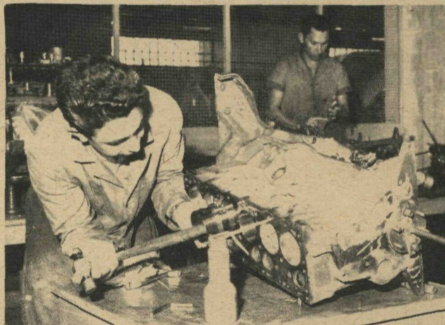
Montagem de um bloco de motor sendo executado na seção de mecânica.

Art. 3o. - Este Decreto entrará em vigor na data de sua publicação, revogadas as disposições em contrário.