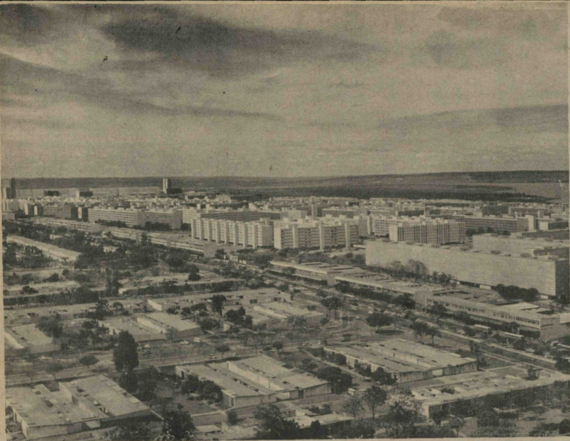
BRASILIA MONUMENTAL - Vista aérea da Asa Sul do Plano-Piloto, podendo-se ver, além do Setor de Habitações Individuais Geminadas, e da Avenida W/3, em primeiro plano, as Superquadras residenciais, cujos blocos são dispostos de maneira variada, obedecendo à regra geral de gabarito máximo de seis pavimentos sobre pilotis. Todas as Unidades de Vizinhança, formadas por quatro Superquadras cada uma, estão sendo dotadas de escolas, playgrounds, comércio local, cinemas, etc