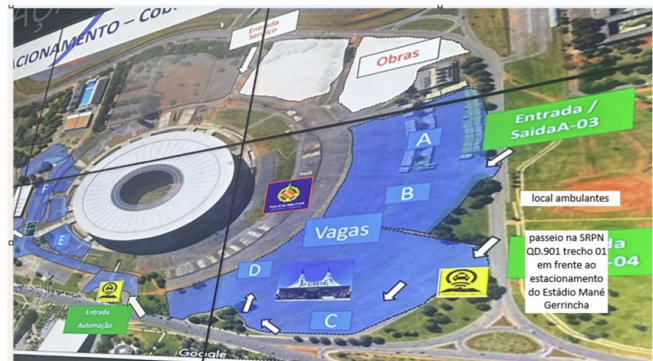
ÁREA 01 – 25 vagas na SRPN QD.901 trecho 01

13.1. Não haverá reserva de vagas no chamamento público para as associações representativas da categoria dos Ambulantes.