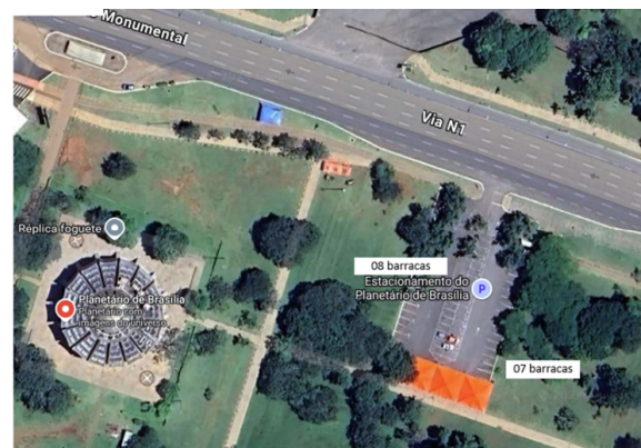
ÁREA 02 - 15 vagas GRAMADO AO REDOR DO ESTACIONAMENTO PÚBLICO DO PLANETÁRIO DE BRASÍLIA.